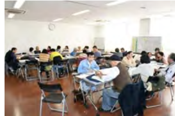
ひらやま 平山クラス