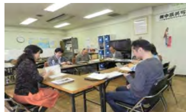
ちゅうごくご 中国語