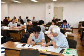
どよう 土曜クラス