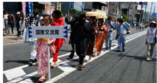
しんせんぐみ ひの新選組まつり パレード