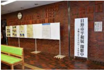
ひのしへいわてん 日野市平和展

まいとし ひ の ししゆさい へいわてん ひ の しさんぎやう きんかじゆつてん もよひ ひ の しなひ きんりんちいき 毎年日野市主催の平和展や、日野市産業まつりに参加出展をしております。この催しは日野市内ならびに近隣地域 だんたい じゆみん おどず ひごろ かつどうじやうきやう しょうかい おお かつ た そんざい し ねが 団体、住民が訪れますので、日頃の HIFA の活動状況を紹介、多くの方に HIFA の存在を知っていただきたいと願っ ております。2019年度は 産業まつりのメインステージで 会員によるフォルクローレの演奏をおこないました。