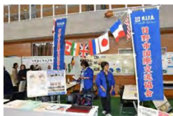
しみん まちづくり市民フェア