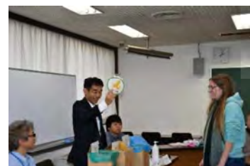
ぷらごみぶんべつこうしゅうかい プラごみ分別講習会