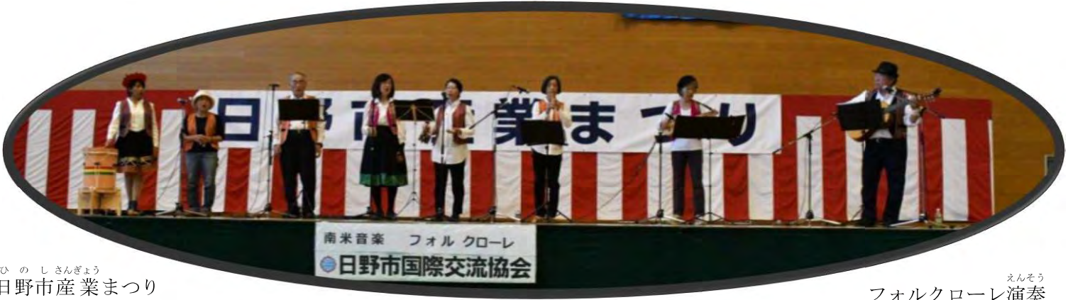
ひのしさんぎやう 日野市産業まつり