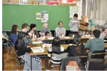
かよう 火曜クラス