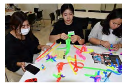
せかい ぶんか 世界の文化