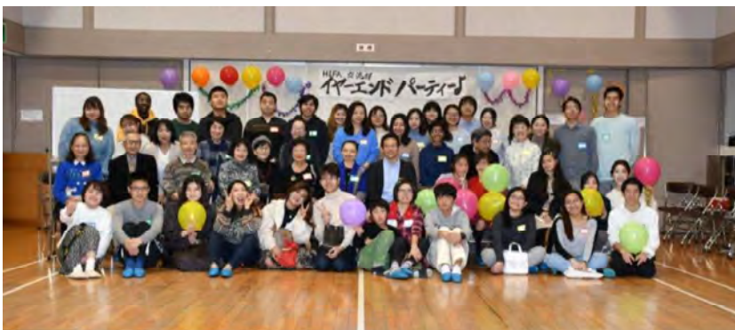
イヤホンパーティー 集合写真