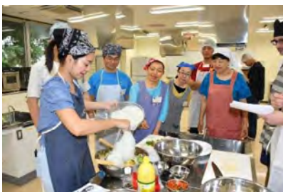
せかい りょうり 世界の料理