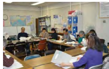
かんこくご 韓国語