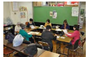
にほんご よ かた はな かた 日本語の読み方・話し方

ひごろ がくしゅう さまざま きょうかいかつどう じっせん やくだ また日頃の学習を様々な協会活動で実践し、役立てています。