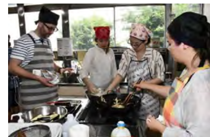
にほん りょうり 日本の料理