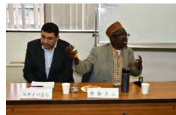
ぶんかこんだんかい イスラム文化懇談会