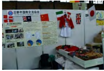
ひのしさんぎやう てんじ 日野市産業まつり展示