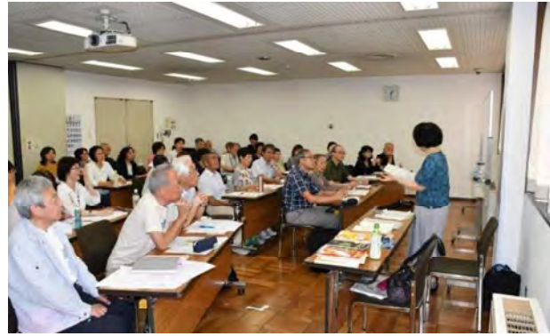
けんしゅうかい ボランティア研修会

せいじんむけ こむ にほんごきょうしつ まいしゅうおおぜい 成人向け（3クラス）、子ども向け（1クラス）の日本語教室に、毎週大勢 がいこくじん にほんじん かた さんか の外国人・日本人の方が参加しています。 にほんご べんきょう おおがたいふう じしん こ がっこう 日本語の勉強だけではなく、大型台風や地震のこと、子どもの学校のこと、 りょうり はな あ お料理のことなどについても話し合っています。 こくさいこうりゅう おおぜい みな にほんご き もら 国際交流フェスティバルで大勢の皆さんに「日本語スピーチ」を聴いて貰 うのも、とても楽しいです。 こくせき こ あたら なかま ま 国籍を超えた新しい仲間を待っています！