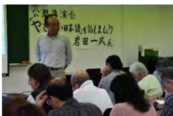
にほんご 「やさしい日本語」講演会