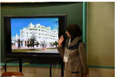
ちゅうがっこうほうもん ひの だいにちゅうがっこう 中学校訪問（日野第二中学校）