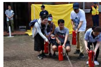
ぼうさいくねん 防災訓練

しょうしこうれいか せんじん き くに こんご かっこく ひとびと きょうせい ついきゅう 少子高齢化の先陣を切るこの国は、今後ますます各国からの人々との共生を追求していかねば ならないはず。その流れを途絶えさせないためにも、まずはマジョリティーである日本人の側 が かわり ちきゅうしみん しや も たようせい い く やす まち みちか ところ が変わり、地球市民としての視野を持ち、多様性を活かした暮らし易い街づくりを、身近な所か ら じっせん ひのしこくさいこうりゅうきょうかい きよてん ちい かつどう つつ 実践していきませんか。日野市国際交流協会は、その拠点として小さな活動を続けていきます。 たよ ふらりと立ち寄ってみてください。