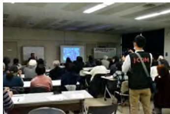
たぶん かきょうせいしみんこうぎ 多文化共生市民講座