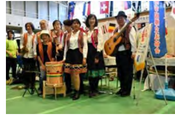
えんそうしや フォルクローレ演奏者