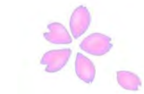
ひがえ 日帰りバスツアー